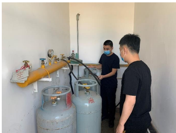
精准、再全面的排查，有效防范安全事故的发生，确保瓶装液化石油气安全使用。

为深刻吸取通州区液化气爆炸事故的教训，遏制类似事故发生，空港股份高度重视，集中力量，对所管辖范围内瓶装液化石油气开展安全检查。此次检查主要对瓶装液化石油气使用单位进行再排查，再摸底，确保安全使用。