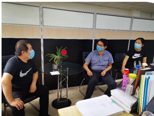
“两会”期间各项保障工作。

为深入贯彻落实空港开发纪委《关于全国两会召开期间强化监督检查的通知》，股份公司对强化服务保障、疫情防控、复工复产、安全维稳等工作进行再部署，力争做好“两会”期间各项保障工作。